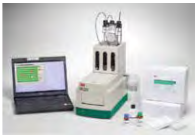
Микробиологическая люминесцентная система 3M™ MLSII