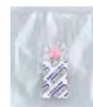
В индивидуальной упаковке