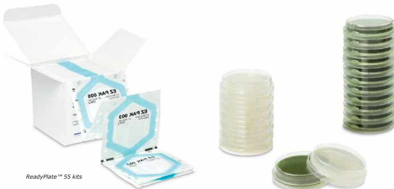
ReadyPlate™ 55 kits

Будучи значительно меньше 90 мм чашек, ReadyPlate™ 55 освобождают дополнительное пространство в инкубаторе и сокращают количество отходов. Чашки ReadyPlate™ 55 обеспечивают пользователей дополнительными возможностями при хранении, т.к. большая часть сред может храниться при комнатной температуре и тем самым снижаются затраты на холодильное оборудование.